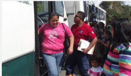
El simulacro se planeó dentro de las actividades del Congreso Mundial Ciudades en Volcanes. (F. S.)